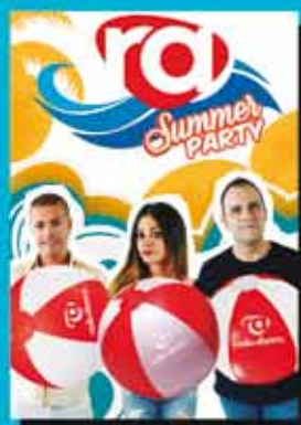
RÀDIO ABRERA SUMMER PARTY

DIVENDRES 30 JUNY PARC CAN MORRAL 23:55H A 05:00H