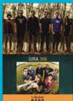
LA BÁMBULA 01:45H