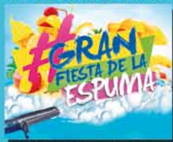
MÚSICA, AIGUA, INFLABLES & ESCUMA #GRAN FIESTA DE L' ESCUMA 16:00H A 20:00H

DIUMENGE 2 JULIOL PARC CAN MORRAL 16:00H A 20:00H