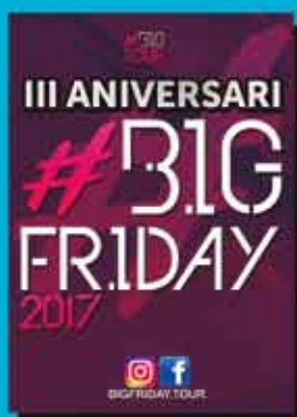
#BIG FRIDAY III ANIVERSARI